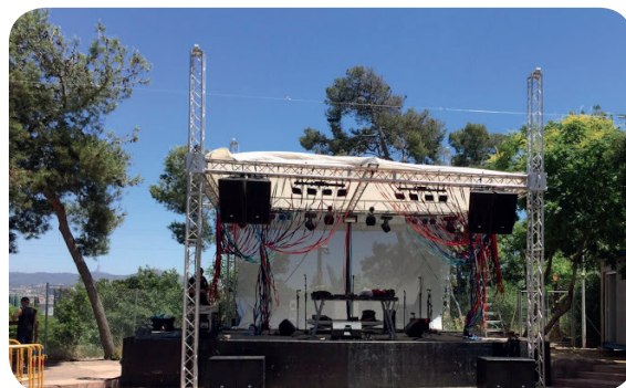
ARTENOU Sant Boi del Llobregat

Sonorización, iluminación y proyección audiovisual.