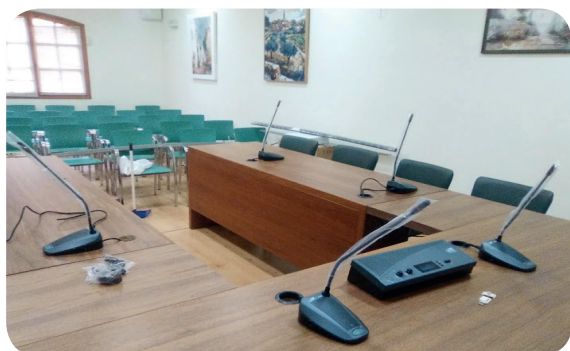
SALA DE PLENOS AYUNTAMIENTO Albinyana

Sonorización, iluminación y proyección audiovisual.