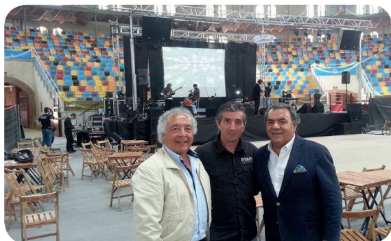
LOS DEL RIO Tarraco Arena - Tarragona